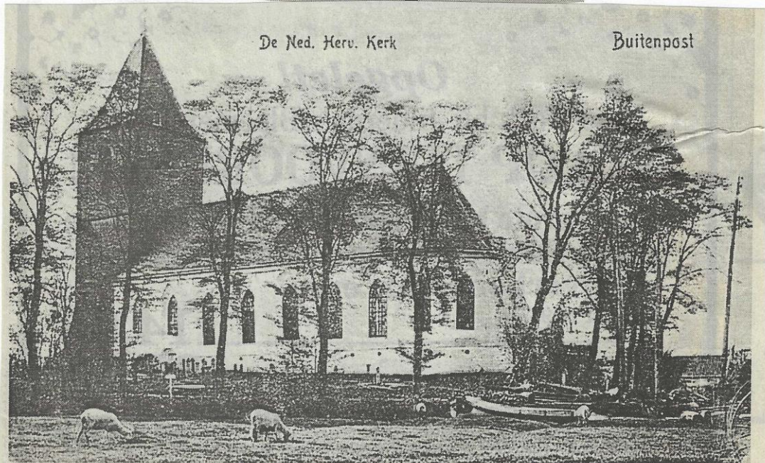
De Ned. Herv. Kerk